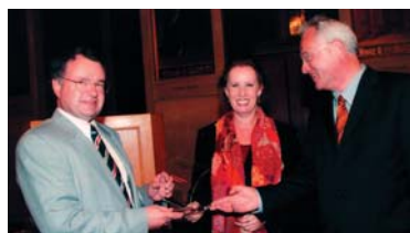
Verleihung des Dt. Fundraising Preises

Wir danken Ihnen für die gute Zusammenarbeit, die langjährige Verbundenheit und die hervorragende redaktionelle Gestaltung unseres Online-Newsletters Fundraising aktuell.