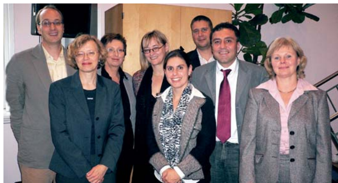
Vorstand des Dt. Fundraising Verbandes

Der Vorstand des Deutschen Fundraising Verbandes