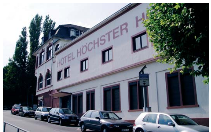
Gründungsort des Deutschen Fundraising Verbandes e.V.

Ich hoffe, er bleibt dem Deutschen Fundraising Verband noch lange verbunden.